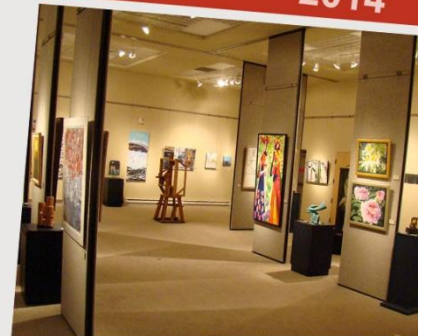
SALLE JEAN PAUL-LEMIEUX Bibliothèque Étienne-Parent, 3515 rue Clemenceau